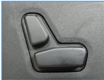
보조석 시트 컨트롤 스위치 11핀 커넥터(커넥터 뒷면)